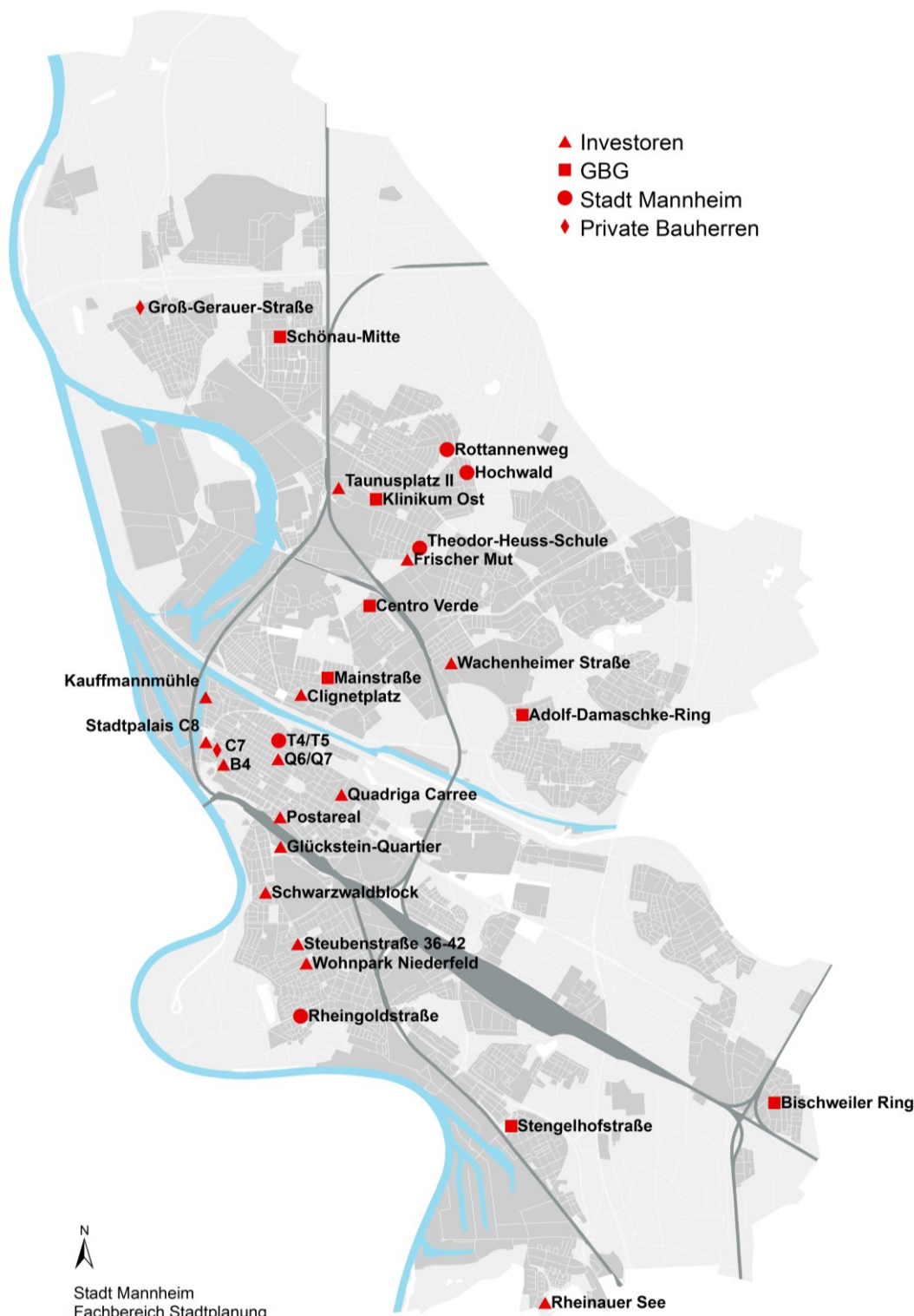
Abb. 2: Wohnungsbauschwerpunkte Mannheim 2016 – 2020 (ohne Konversion)

Der Großteil der bis 2020 entstehenden Wohnungen wird im Geschosswohnungsbau entstehen. Dabei handelt es sich um freien Wohnungsbau, der aufgrund der Grundstücks- und Baupreise, nicht zuletzt aber auch aufgrund der Nachfrage in diesem Segment, i.d.R. hochpreisig angeboten wird. In den aufgelisteten Projekten ist aufgrund einer fehlenden Rahmensetzung nur auf freiwilliger Basis eine nachträgliche Implementierung preisgünstiger Wohnungen in begrenztem Umfang möglich. Es wird deshalb in diesem Kapitel lediglich ein Zielwert von 50 preisgünstigen Mietwohnungen angesetzt.