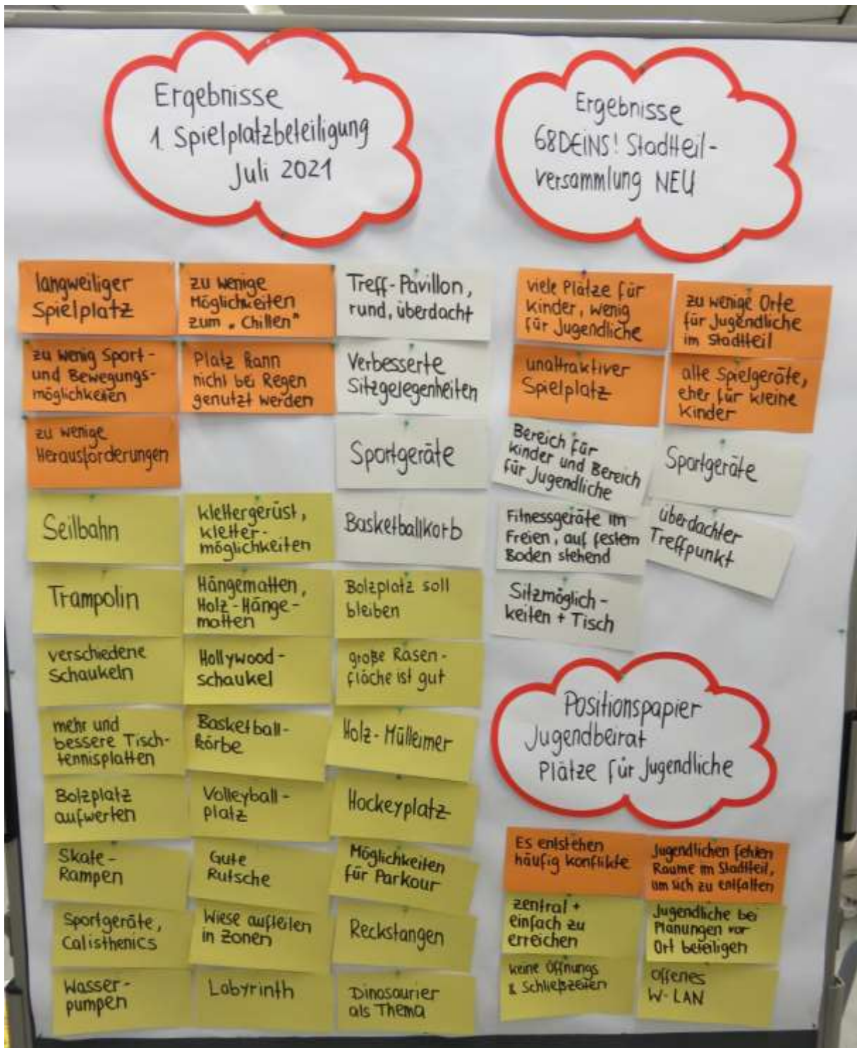
Anlage 1: Ergebnisse der Stadtteilversammlung für Kinder und Jugendliche in Neuhermsheim im März 2021 und des ersten Beteiligungsworkshops zur Aufwertung der Spielanlage Landsknechtweg im Juli 2021