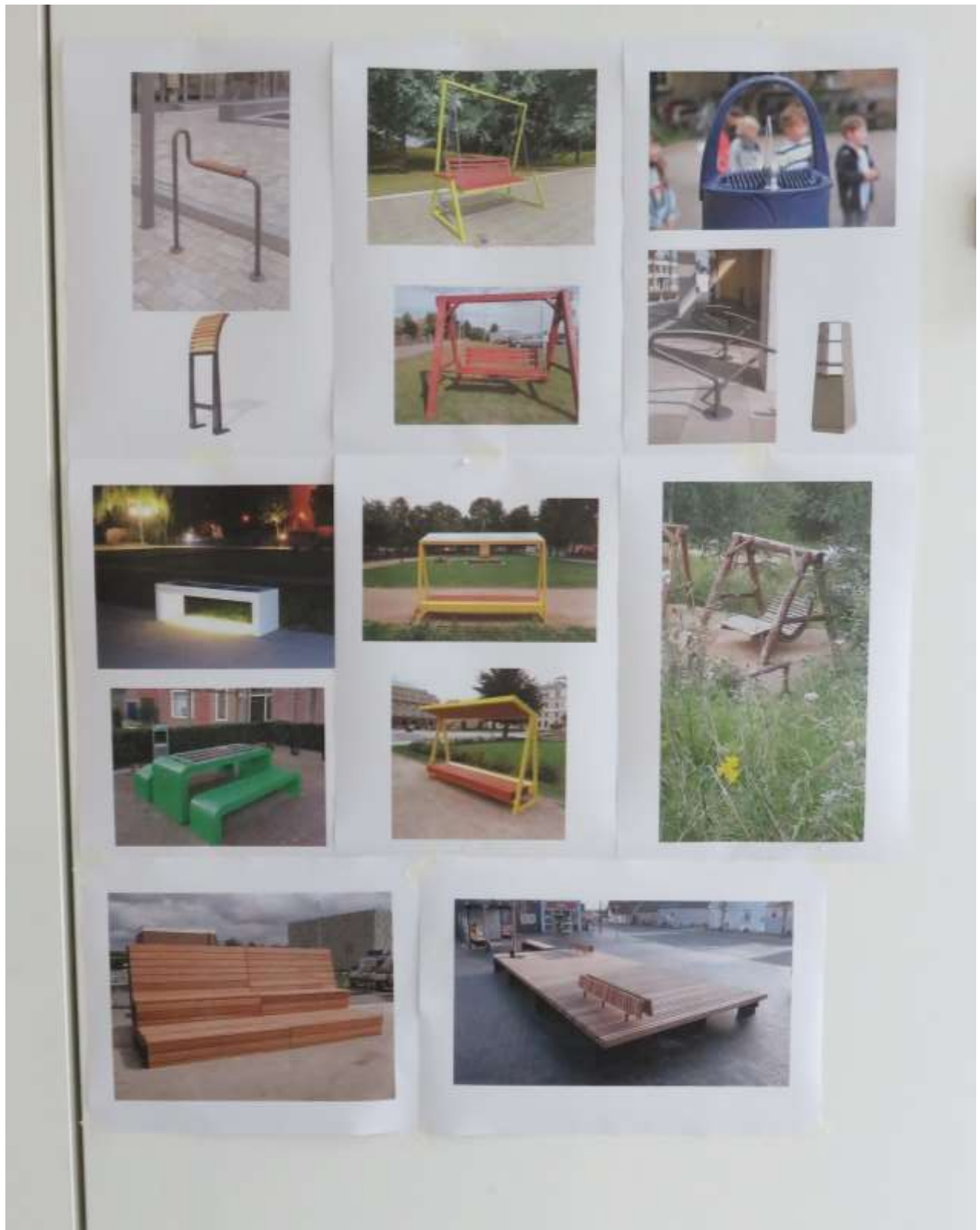
Anlage 3: Beispiele für Sitz- und Liegemöglichkeiten und erste Priorisierung durch die Teilnehmenden.