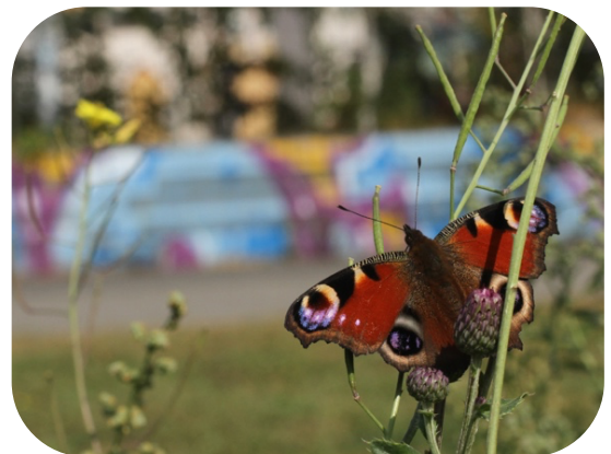
Tagpfauenauge, Lene Voigt Park, Leipzig.

Der Bereich sollte idealerweise 20x25 Meter groß sein. Falls die von Ihnen ausgewählte Grünfläche schmaler ist kann der Bereich auf 10x50 Meter oder 5x100 Meter angepasst werden.